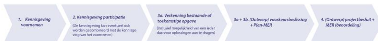
Figuur 1. Projectprocedure

Het project Zuidelijk Maasdal volgt de projectprocedure uit de Omgevingswet (Ow). De projectprocedure Ow voor het project Zuidelijk Maasdal ziet er als volgt uit: